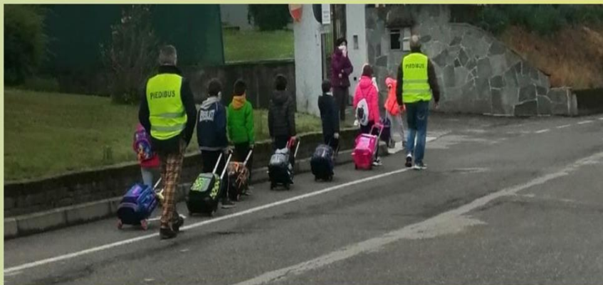
Pedibus Aicurzio: indomiti

... assumendo a riferimento le seguenti tematiche: